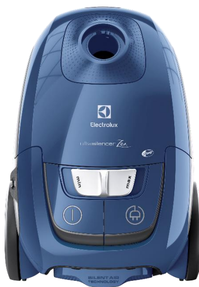
Couleur : Bleu acier

Poignée de transport mobile Intégrée sur le dessus de l'appareil