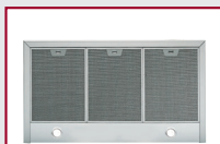
Grande largeur d'aspiration