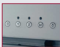
Commande Soft Touch