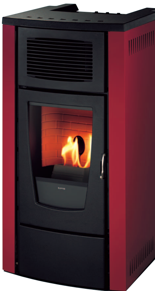
LEMNOS 06 BORDEAUX