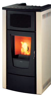
LEMNOS 03 IVOIRE