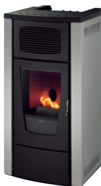
LEMNOS 01 ALU