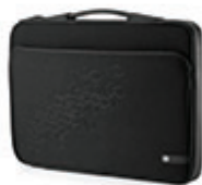
Étui pour ordinateur portable HP Black Cherry, 43,9 cm (17,3 pouces) LR378AA